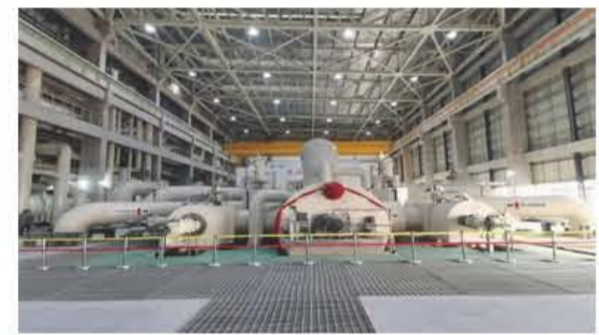
2022年12月26日20时00分，淮南潘集电厂一期2x660MW超超临界燃煤机组工程1号机组一次顺利通过168小时满负荷试运行，标志着潘集电厂向双机投产目标又迈出坚实一步。

机组运行期间，创造了四个一次成功，即：一次性点火成功、一次性3000转冲转成功，一次性并网成功、一次性168试运行成功。机组保护投入率、自动投入率及机组平均负荷率均达到100%，机组运行平稳，各项技术、经济指标均达到国家标准，创同类机组领先水平。