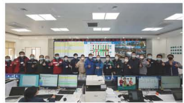
12月9日20:18，白鹤滩—江苏±800千伏特高压直流输电工程双极高低端直流输电系统顺利通过大负荷及过载负荷试验，标志本工程所有系统调试任务取得圆满成功。

布拖±800千伏换流站是白鹤滩水电站送出特高压直流输电工程的送端站，一、二期额定输送功率均为800万千瓦，是世界最大的特高压换流站。整个换流站由2个±800千