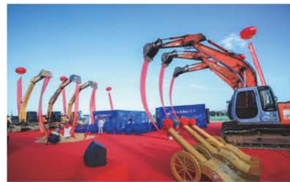
2022年12月28日，华能南山电厂2x46万千瓦燃气-蒸汽联合循环发电机组扩建项目第一方混凝土缓缓倒入5号余热锅炉基础，标志着项目建设正式拉开了序幕。

华能南山电厂扩建项目是海南省“十四五”能源发展规划重大项目之一。本期建设的两台460MW级“一拖一、单轴”燃气-蒸汽联合循环发电机组年利用2900小时，年发电量25亿千瓦时。建成后将大幅提高海南南部尤其是三亚负荷中心的供电可靠性，提高本地电源支撑能力，增强电网对于极端天气的应对能力，有效缓解海南省电力供应紧张局面。