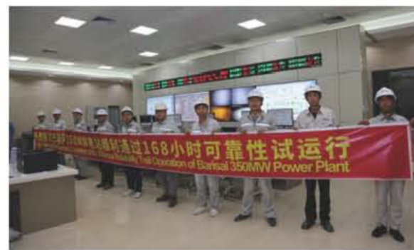
2022年12月31日，孟加拉巴瑞萨燃煤电站项目顺利通过168小时可靠性运行，标志着孟加拉巴瑞萨燃煤电站全面建成，即将进入COD。

2019年10月30日，工程举行开工仪式，第一方混凝土浇筑缓缓流入锅炉基础，为本工程建设正式拉开序幕，全体参建者斗酷暑、战疫情，经过1158个日日夜夜的艰苦奋战，一座以中国标准设计、建造、运行的最清洁、最高效、最环保、最节能的燃煤电站巍然屹立于孟加拉湾畔。